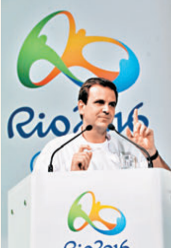
帕埃斯指巴西缺少相關體育政策。資料圖片

里約熱內盧將在2016年舉辦夏季奧運會，但該市市長帕埃斯表示，在目前缺少相關體育政策的情況下，巴西舉辦奧運會簡直是「恥辱」。