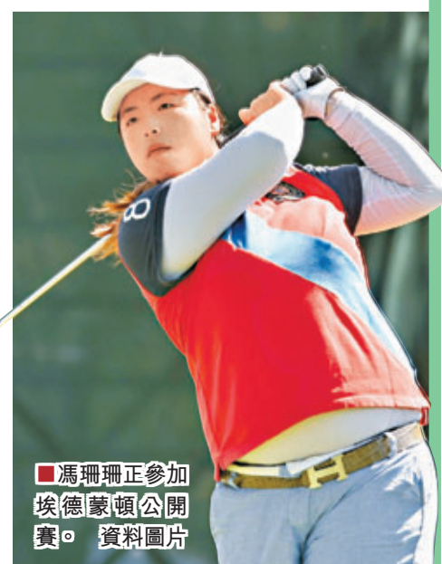
馮珊珊正參加埃德蒙頓公開賽。