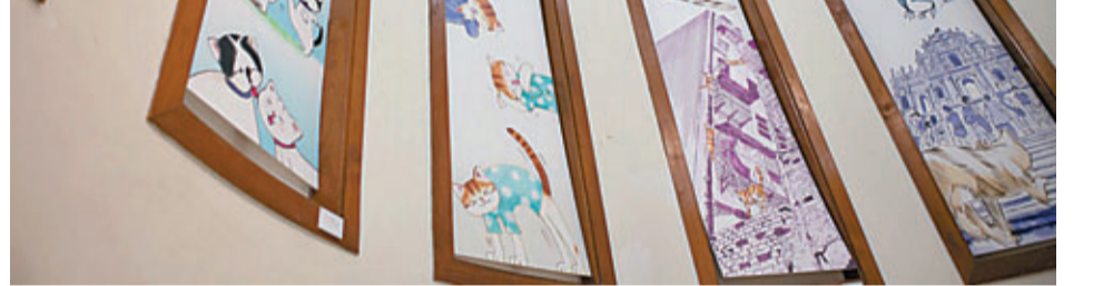
「貓空間」宣傳藝術與慈善護生的概念。

隨着炎夏的到來，永利澳門軒花軒及帝雅廷意大利餐廳的大廚悉心精選時令材料，推出更新的菜譜，為味蕾帶來新衝擊。