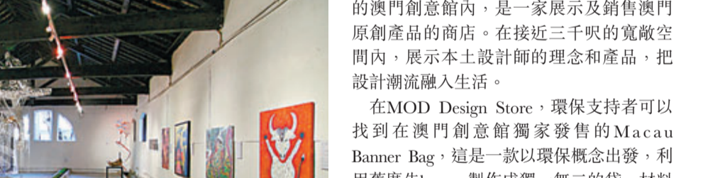
MOD Design Store 位於澳門著名地標大三巴牌坊側，旅遊文化活動中心地庫一層。