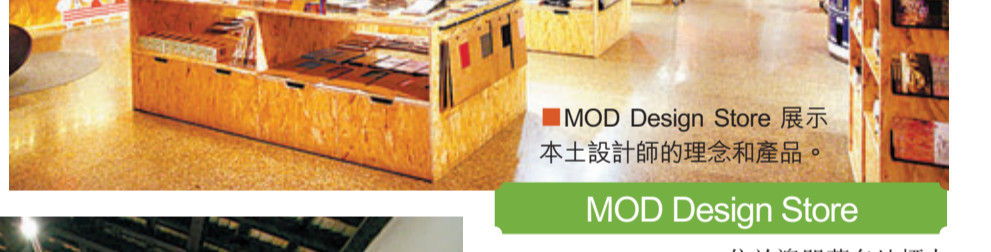
MOD Design Store 展示本土設計師的理念和產品。