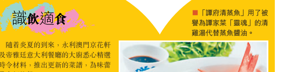
「譚府清蒸魚」用了被譽為譚家菜「靈魂」的清蒸湯代替蒸魚醬油。