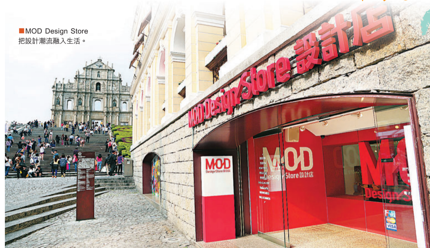
MOD Design Store 把設計潮流融入生活。