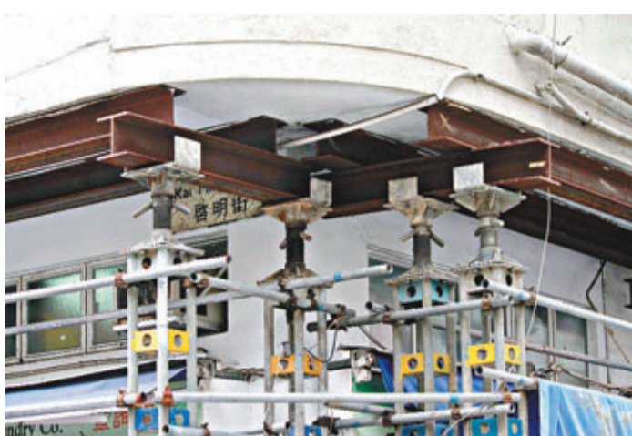
■被封的唐樓1樓用工字鐵支撐。

有居於該唐樓的林婆婆表示，屯門距離土瓜灣甚遠，加上自己患有眼疾，擔心不能適應搬至屯門後的生活，「我連行路都有困難，我不想搬啊」。有在地舖經營乾衣店的負責人對屋宇署安排：「今天才收到封樓通知，一個禮拜後就封樓了，那顧客的衣服應該怎麼辦呢？我怎麼來得及還給他們？」