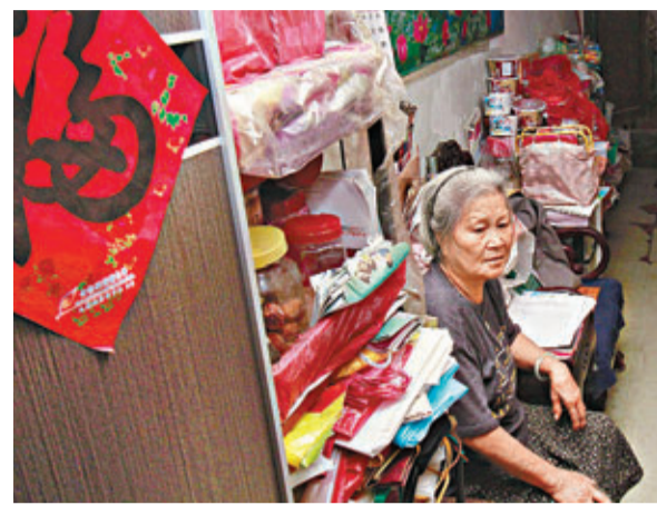
■林婆婆擔心不能適應搬至屯門後的生活。

九龍城區議員楊永杰表示，昨日受到不少居民反映，對封樓感到憂慮。「有很多長者反映，擔心不能適應屯門生活，而有兒女在附近一帶上學的家長則擔心，兒女將來上學會造成不便。」他續說，昨天已在唐樓內點算單位數量，發現樓宇內有超過6個單位有劏房，相信受影響人數將會上升。