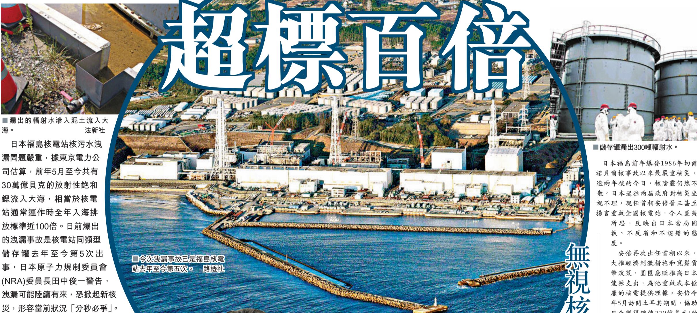
■漏出的輻射水滲入泥土流入大海。

日本福島核電站核污水洩漏問題嚴重，據東京電力公司估算，前年5月至今共有30萬億貝克的放射性銫和銣流入大海，相當於核電站通常運作時全年入海排放標準近100倍。日前爆出的洩漏事故是核電站同類型儲存罐去年至今第5次出事，日本原子力規制委員會(NRA)委員長田中俊一警告，洩漏可能陸續有來，恐掀起新核災，形容當前狀況「分秒必爭」。