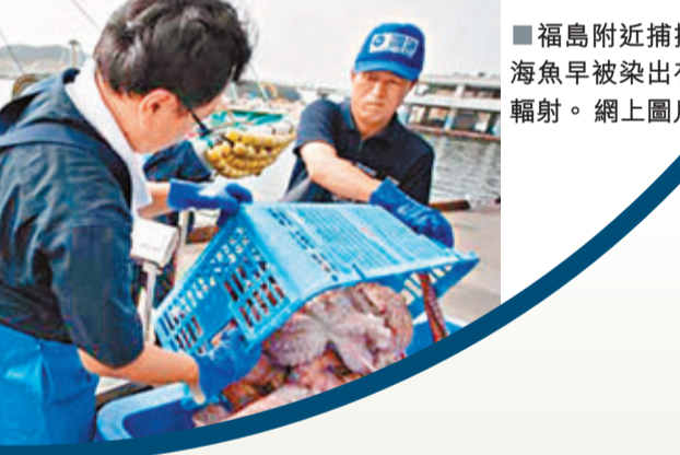
■福島附近捕撈海魚早被染出有輻射。