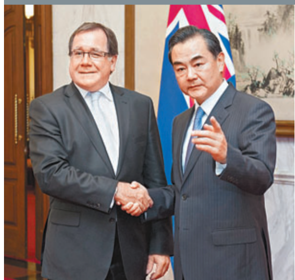
中國外交部部長王毅(右)22日在北京歡迎來訪的新西蘭外交部長麥卡利。

北京說，新西蘭政府就恒天然問題乳品事件在中國消費者中引起的不安「深表遺憾」，強調新西蘭政府致力於通過一個公開、透明的披露機制解決後續問題。