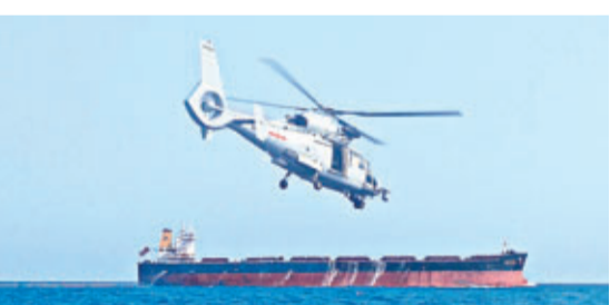
中國海軍21日在亞丁灣、索馬里海域執行聯合護航行動。圖為海軍第十四批護航編隊艦艇直升機巡邏警戒。

此次聯合演習將歷時兩天，是科目最多、範圍最大、實戰最強的一次，創下中美海軍對海火炮射擊、中美海軍特戰隊員聯合行動、中美海軍直升機夜間對海上目標跟蹤監視等多項第一，對於深化中美海軍軍事交流與合作，展現構建「平等互利、合作共贏」的新型軍事關係，提高中國海軍在遠海與外軍聯合執行多樣化軍事任務的能力具有十分重要的意義。