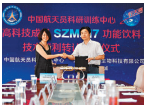
雙方代表簽署專利轉讓協議。

香港文匯報訊(記者 羅洪嘯、王曉雲 北京報道)中國航天員科研訓練中心與北京維天康生物科技有限公司昨日在京簽署國家生物高科技成果SZM317功能飲料技術專利轉讓協議，標誌着由中國航天員科研訓練中心研發、用於航天員恢復體能的功能飲料專利配方將正式轉為民用，該功能飲料被命名為「行天源」，並於明年投放市場。