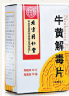
北京同仁堂其中一款牛黃解毒片。網上圖片與大家以為的「神=砒霜」是兩個不同的概念。消費者按照說明書服用，對身體是沒有害處的。

香港文匯報訊 據中國經濟網報道，近日，英國藥品及保健品管理局(簡稱英國藥品局)發佈了一則中藥警告，稱北京同仁堂牛黃解毒片中含有巨量的有害物質。對此，同仁堂做出回應稱，牛黃解毒片中的神是以穩定的化學物質形態存在，與大家以為的「神=砒霜」是兩個不同的概念。消費者按照說明書服用，對身體是沒有害處的。