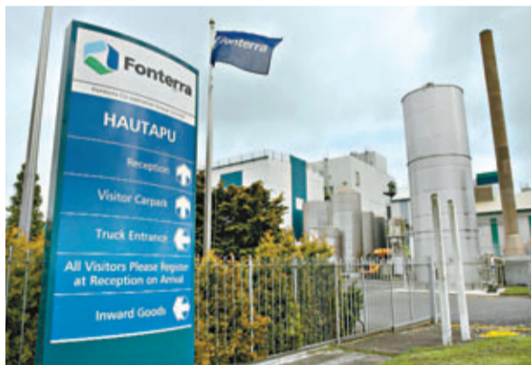
恒天然公司位於新西蘭的奶粉廠。

談及是否會對中國消費者進行賠償，麥卡利說，從政府角度來說，「我高興地看到在現階段，我們只是在做產品召回。」至於新西蘭政府是否會追究恒天然集團的法律責任，他說，目前針對此事的調查仍在進行，要等到相關機構的調查結束之後才能知曉。