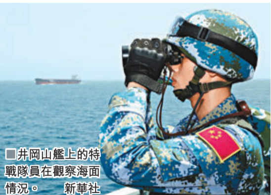
井岡山艦上的特戰隊員在觀察海面情況。