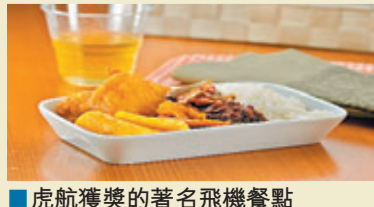
■虎航獲獎的著名飛機餐點