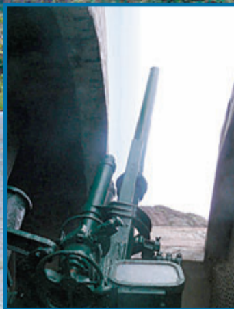
■炮口對海平面的那端是宜蘭南方的北方澳