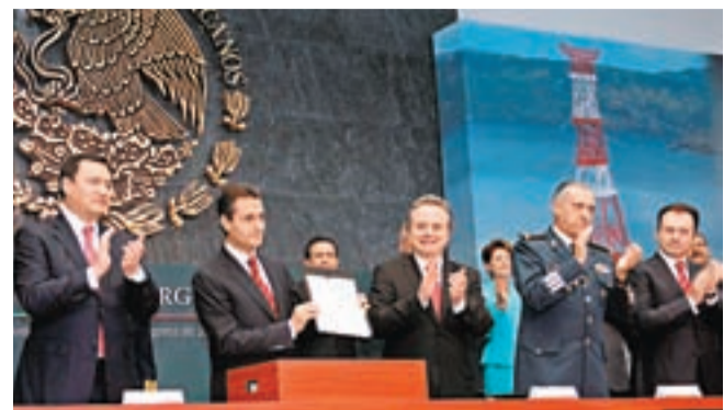
墨西哥總統培尼亞(左二)與能源部長佩德羅·華金·科德韋爾(中)、內政部長米格爾·安赫爾·奧索奧·鐘(左)一起參加石油改革提案的簽署活動。 資料圖片

健康護理、2.6% 運輸、1.8% 休閒、1.7% 工業、1.6% 科技及 0.4% 汽車及房屋。 資產百分比為99% 股票及1% 貨幣市場。基金三大資產比 重股票為5.27% 淡水河谷、3.83% Itau Unibanco Holding S.A. 及3.75% Petroleo Brasileiro S.A.。