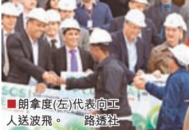
■朗拿度(左)代表向工人送波飛。

2014年巴西世界盃門票昨日通過國際足聯官網上開售，分組賽的最低票價是90美元，7月31日在馬拉簡拿球場上演的非特惠票價為440至990美元。球迷需在今年10月10日前網上申請，由系統抽籤。11月5日門票銷售進入次階段。