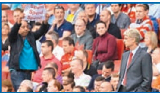
■阿仙奴球迷向領隊雲加(右)表達要花錢增兵的訴求。

阿仙奴想走出8年無冠的困境，坐擁8000萬英鎊擴軍預算，今夏卻只引入自由身的耶耶辛洛高，希古恩與古斯達等球星都拒絕加盟。上周末首輪英超聯賽，「兵工廠」更賠了夫人又折兵，今晚歐聯附加賽首回合分兵接戰土耳其勁旅費倫巴治，的確令人擔憂。(有線61台及201高清台周四凌晨2:45a.m.直播)