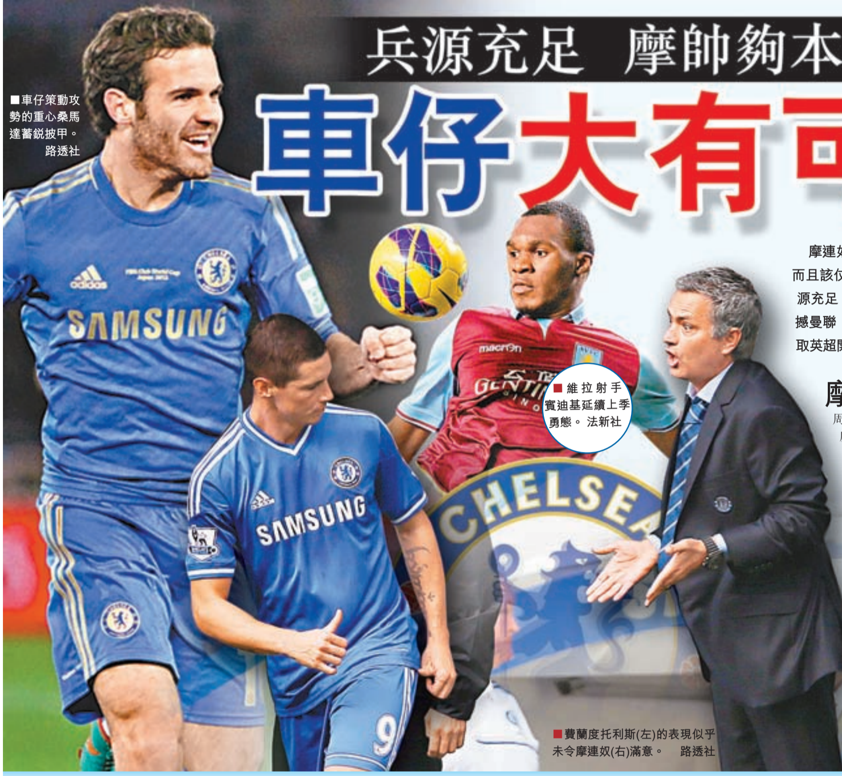
■維拉射手實迪基延續上季勇態。