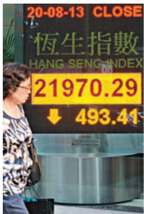
憂美國退市及資金撤出，港股昨日收市挫近500點，失守22,000點。

至於昨日的市況，本來上週中國公布的多項經濟數據理想，內地股市及港股都受到刺激，重拾升勢，然而此利好消息效力未能持續。本週將舉行全球央行年會，美聯儲今日亦將公布新一輪的會議紀錄，環球資本市場都在靜候美聯儲會否再透露更多的退市細節。由於擔憂退市計劃進一步落實，資金