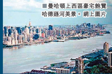
曼哈頓上西區豪宅飽覽哈德遜河美景。

紐約市政府設立的「包容性住屋項目」，訂明發展商若為低收入家庭興建或保留住宅單位，便可獲稅務減免，並興建更多樓層。發展商Extell最近發展曼哈頓上西區一幅海景地皮，計劃興建樓高33層，共274個單位的豪宅，並保留其中55個單位供低收入人士入住；所得的額外建築樓層面積，將出售予市內另一大廈圖