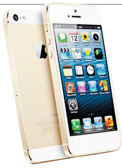
科技網擬推香檳金iPhone 5S。

外界盛傳蘋果公司將於下月10日推出iPhone 5S及廉價版iPhone 5C，但有研究報告指出，蘋果會把iPhone 5C定價於400至500美元（約3,102至3,877港元）之間，屬中價貨品，以取代現有的iPhone 5，而iPhone 4S的價格則可能被調低至300至400美元（約2,326至3,102港