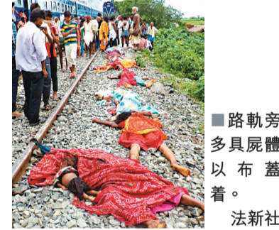
集在火車站，阻止當局移走路軌上的屍體。

印度國家鐵路董事會主席庫馬爾表示，火車不會在該站上落客，「車站內有3條路軌，另外兩條當時都停有火車，人群在第3條路軌上走動」。職員指，部分人以為火車會停頓，故並未離開。逾5,000人其後聚