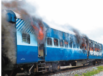
車廂着火冒出濃煙。

事發地點為比哈爾邦首府巴特那約160公里以外的火車站，目擊者表示，遇難者大部分為印度教濕婆派信徒，他們當時站在路軌上，火車疾馳而至，部分死者被撞至身首異處。