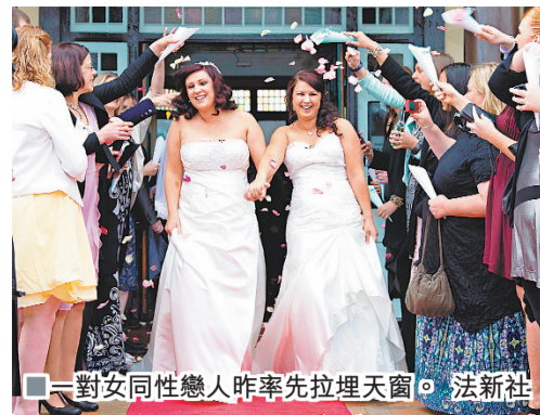
一對女同性戀人昨率先拉埋天窗。