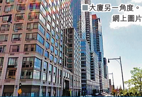
大廈另一角度。

英國電視劇《唐頓莊園》中，僕人須用其他出入口進出莊園，見到主人時更要彎身點頭。美國紐約有發展商為取得稅務優惠，在住宅大廈同時設置豪華及廉價單位，但故意安排兩個出入口，分開富人及窮人，引起輿論反響，認為此舉鼓吹階級分化，立下極壞先例。