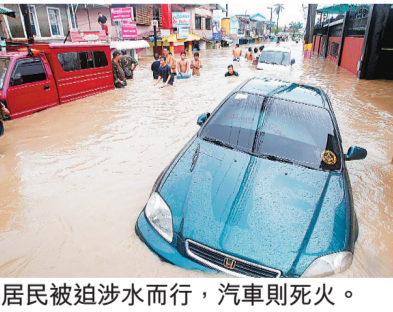
居民被強迫涉水而行，汽車則死火。