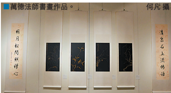
■萬德法師書畫作品。