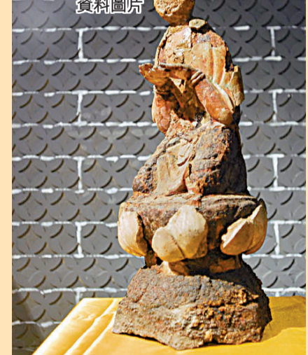
■全世界唯一發現的雙膝跪姿捧真身菩薩造像 資料圖片