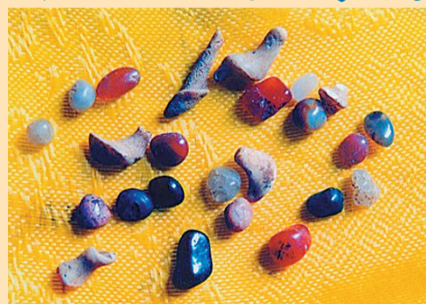
■太子靈蹤塔地宮內出土的部分舍利