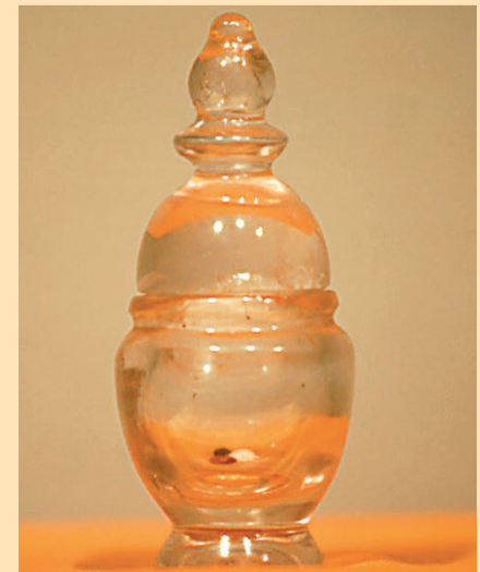
■太子靈蹤塔地宮內出土的水晶舍利瓶