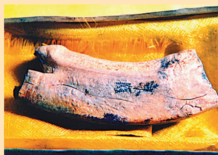
■太子靈蹤塔地宮內現世的佛牙 資料圖片

釋迦牟尼佛真身舍利被奉為佛教無上至寶，陝西法門寺指骨舍利、南京棲霞寺佛頂骨舍利都先後赴滬，台供奉瞻禮，曾獲得萬眾空巷虔誠膜拜。1994年，山東汶上寶相寺內出土了佛教聖物佛牙以及舍利、文物141件，被評為「史無前例」。這件佛教聖物的現世，引出了一段流轉千年的傳奇歷史，更因牽涉北宋「王安石變法」而平添歷史價值。其現世後，屢屢出現的佛光等聖跡為其蒙上一層神秘色彩。借助佛牙聖物，汶上寶相寺正在打造禪修等體驗項目，以佛家文化理解當代人的精神焦慮，弘揚佛家慈悲的理念。