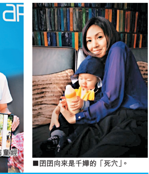
■田田向來是千嬅的「死穴」。