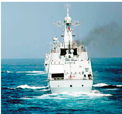
■海軍在南海組織驅護艦編隊對空防禦、模擬導彈攻擊、主副炮射擊等訓練課目。

香港文匯報訊 據中國海軍網報道,近日,南海某海域,一支驅護艦編隊犁浪前行。作戰指揮室內,各級指揮員表情嚴肅,雙眼緊盯前方大屏。「距離××,方位××,發現『敵』方潛艇。」突然,一聲清脆的報告聲讓室內氣氛更加緊張。「鎖定目標,將目標信息發送到編隊各艦。」「對潛攻擊,發射!」隨著指揮員一聲令下,各艦快速協同,操作手輕點按鈕,利用艦首火箭深彈對「敵」潛艇實施精確打擊。火箭彈呼嘯而出,遠處的海面上一道水柱冲天而起,「敵」潛艇頃刻間葬身海底。在接下來的4天訓練中,「敵」情隨時出現,時而電磁干擾,時而導彈來襲,時而凌空轟炸。各級指戰員克服連續高強度作戰帶來的疲憊,沉着應對,成功化解各種威脅,對「敵」來戰兵力進行有效打擊。幾天來,編隊防空防禦、模擬導彈攻擊、主副炮射擊等訓練課目輪番上陣,好戲連台。