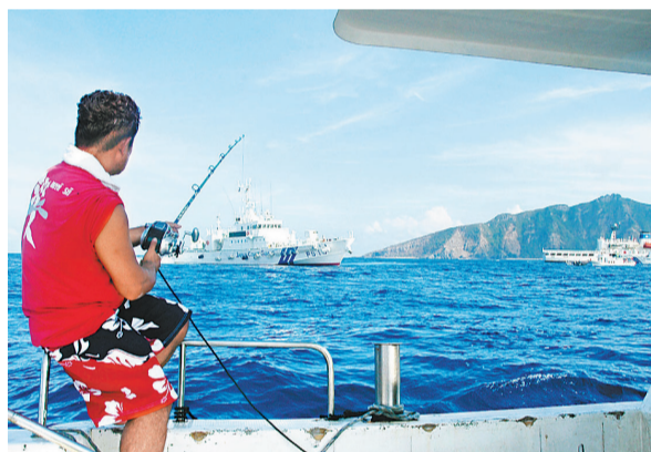
■20名「加油日本!全國行動委員會」成員昨日清晨抵達釣魚島附近的水域滋事。

據報道,約20名「加油日本!全國行動委員會」成員昨日清晨抵達釣魚島附近的水域,宣稱要宣示日本對釣魚島的主權。當船隻駛到釣魚島一海里範圍時,大約十艘日本海上保安廳船隻和橡皮艇將他們包圍,並呼籲他們離開。這些船隻隨後返航,沒有發生登島行為。據悉,這已經是該組織第16次組織前往釣魚島海域捕魚,今年已經是第6次。因此,日本主流媒體對今次事件已經無心關注。