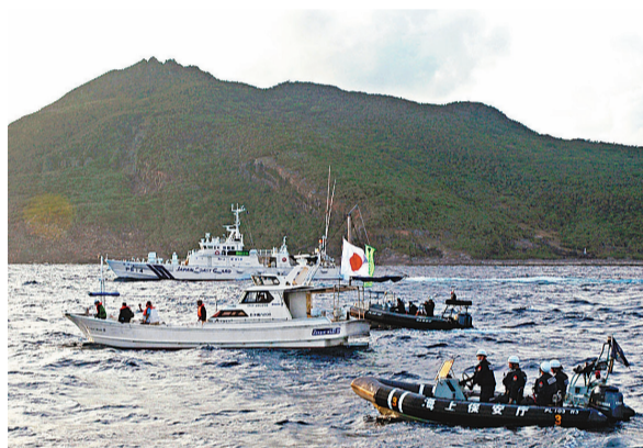
■日本右翼組織船隻遭日本海上保安廳船隻和橡皮艇包圍。

香港文匯報訊(記者 馬靜 北京報道)日本右翼組織「加油日本!全國行動委員會」再起事端。據媒體報道,該組織約20名右翼分子昨日分乘五艘船隻再度非法進入釣魚島1海里海域,遭日本海上保安廳勸阻返航。中國清華大學當代國際關係研究院副院長劉江永對本報表示,該組織主要目的就是通过一系列行動破壞中日關係。他說,日本右翼組織在釣魚島一再的挑釁行為無疑是向中國海警船在釣魚島加強執法發出的「邀請信」。