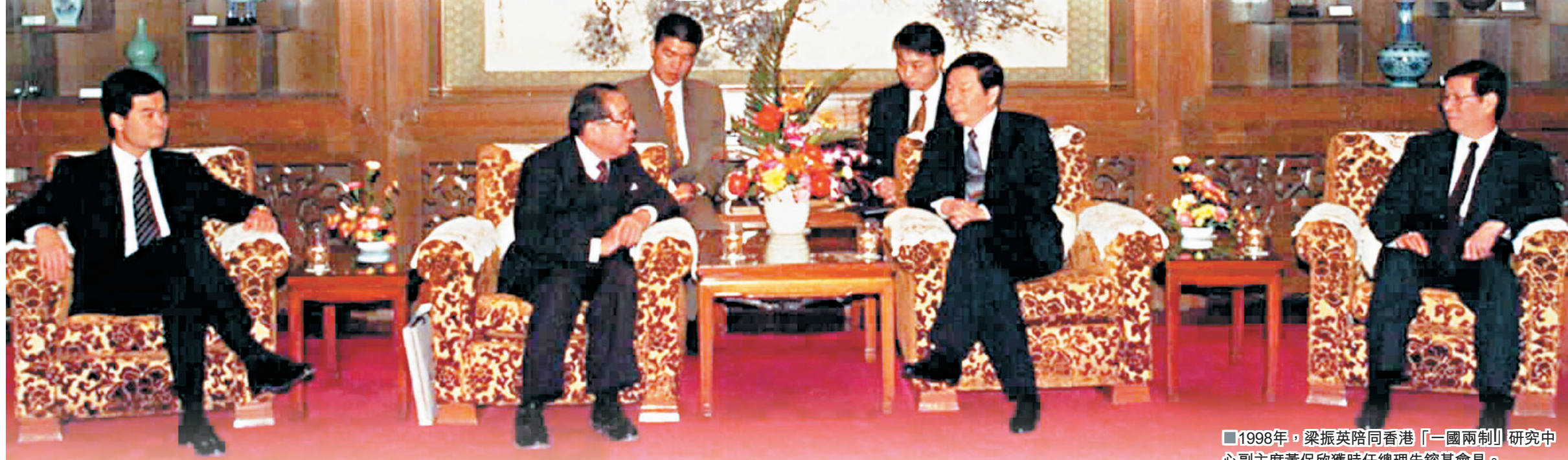
1998年，梁振英陪同香港「一國兩制」研究中心副主席黃保欣獲時任總理朱鎔基會見。

在最新出版的《朱鎔基上海講話實錄》中，首次披露了原國務院總理朱鎔基在任上海時，曾就當地發展中遇到的土地住房等問題，虛心請教比他年幼20多歲、時為仲量行董事的梁振英，詢問他香港的相關經驗，反映了領導人充分肯定梁振英對香港發展經驗的充分掌握，對土地住房問題的精闢見解，以至對管治香港的信念及能力。香港社會各界均認為，梁振英上任特首以來，憑藉「穩中求變、務實為民」的理念「逆境界戰」，在經濟民生、房屋及貧窮等問題上勇於承擔，漸見成績，各界應支持特區政府施政，讓香港穩步向前發展。 ■香港文匯報記者 鄭治祖