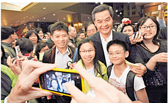
梁振英落區，市民爭相合照。