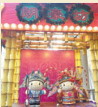
■「大筐地戲棚」似曾相識