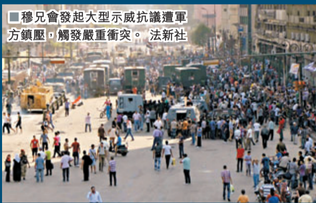
穆兄會發起大型示威抗議遭軍方鎮壓，觸發嚴重衝突。

埃及穆斯林兄弟會前日發起「憤怒日」大示威，抗議軍方鎮壓前總統穆爾西支持者，觸發嚴重衝突，全國各地最少173人死亡，穆兄會昨號召支持者在一周內每天發起大規模示威。專家指，軍方的鎮壓經精心計算，目的是刺激穆兄會使用暴力，藉以將之斬草除根，難以重返政壇。穆兄會或轉入地下活動，為埃及今後政治進程和社會穩定埋下嚴重隱患。過渡政府總理貝卜拉維昨日提出解散穆兄會。