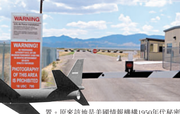
置。原來該地是美國情報機構1950年代秘密測試U-2偵察機的場所，試飛期間由於飛得太高，導致民眾目擊UFO的報告次數劇增。當地還測試過其他絕密飛機，如A-12超音速偵察機、F-117隱形地面攻擊機等，但都與飛碟無關。而與「51區」傳說最大關連的「羅斯威爾事件」，報告則絕口不提。1947年，有報道指美國空軍在新墨西哥州羅斯威爾發現墜毀的UFO和外星人屍體，坊間盛傳UFO殘骸和外星人屍體就被儲存在「51區」。