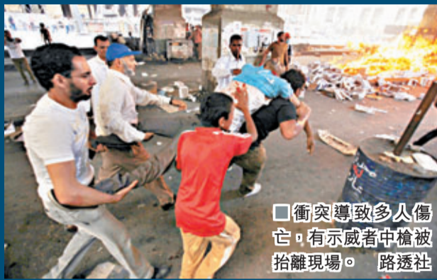
衝突導致多人傷亡，有示威者中槍被抬離現場。