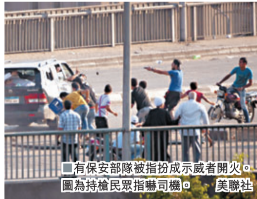
有保安部隊被指扮成示威者開火，圖為持槍民眾指嚇司機。