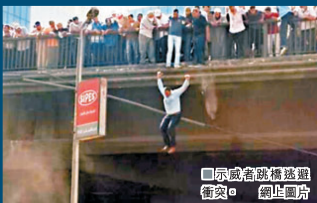
示威者跳橋逃避衝突。