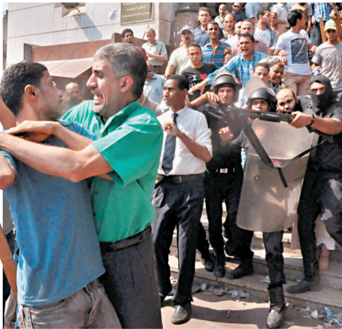
穆兄會支持者制止同伴襲擊警方。