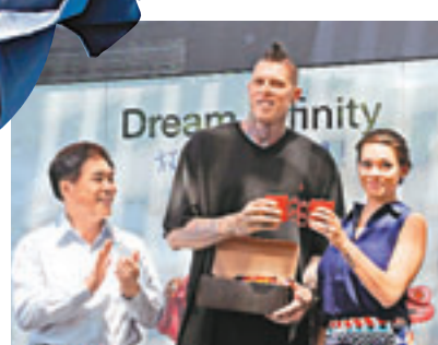
■基斯安達臣(中)與未婚妻(右)獲台北市長郝龍斌送贈喜蛋。

另外，熱火冠軍成員「鳥人」基斯安達臣，日前安達臣的未婚妻大方展示鑽戒，宣布兩人的結婚計劃，台北市長郝龍斌得知此事後，便熱情邀請安達臣和他的未婚妻未來能再回到台北舉辦婚禮，並承諾到時他一定親自擔任證婚人。