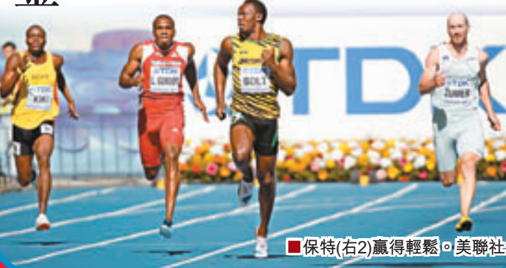
■保持(右2)贏得輕鬆。