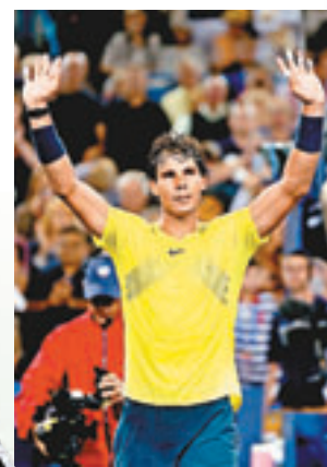
■拿度期待再戰費達拿。