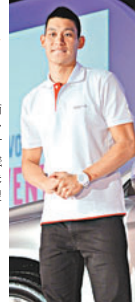
■林書豪繼續其訪台之旅。

安達臣的準岳母是台灣人，安達臣的未婚妻則有一半的華人人血統，因此安達臣未來會是「正宗的台灣女婿」。對於嫁女這件大事，安達臣的準岳母說，她們旅居美國多年，但還有很多親朋好友在台灣，所以希望女兒和安達臣除了在美國結婚外，小兩口也能在台灣再辦一次婚禮，讓親戚、朋友沾沾喜氣。