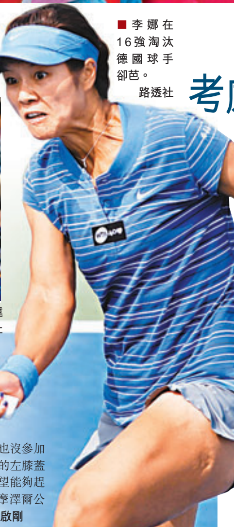
■李娜在16強淘汰德國球手卻芭。