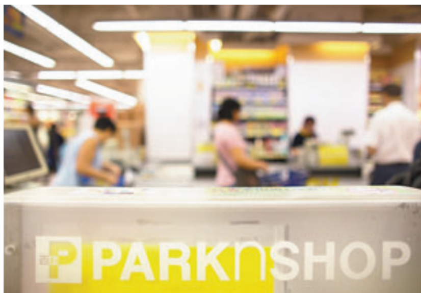
市場消息指, 屈臣氏集團收到8份有意洽購百佳的意向書, 比市場預期的7份還要多, 反映市場對百佳多年來的管理層、員工的成績充分肯定。

資料圖片擁有市場佔有率排第三的華潤萬家超市, 過去大半月來一直是最被市場看好的對象。