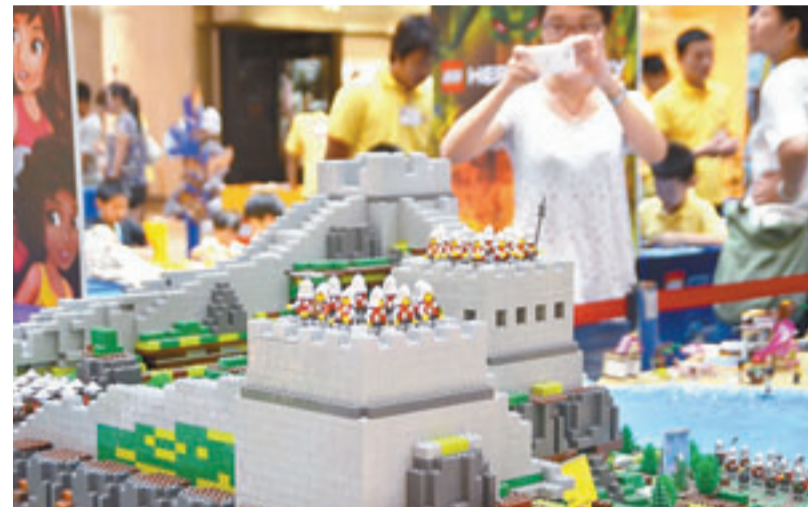
江蘇積木地標 2013樂高卡車秀「世界暢遊之旅(中國巡展)」昨日在江蘇蘇州開展...