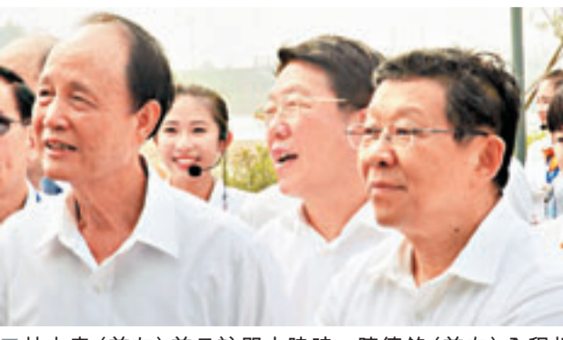
林中森(前左)前日訪問大陸時,陳德銘(前右)全程相陪,林中森對此表示謝意。