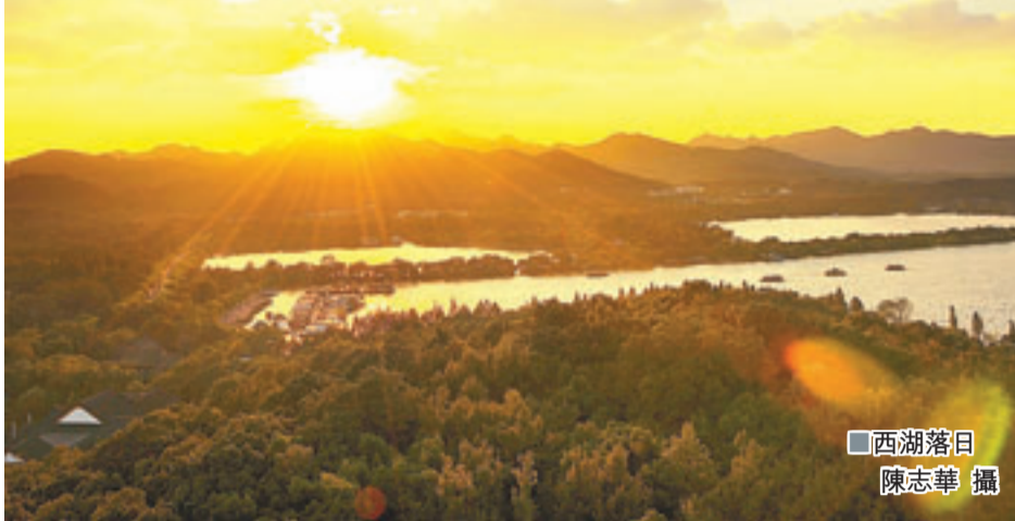
西湖落日