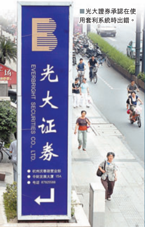
■光大證券承認在使用套利系統時出錯。