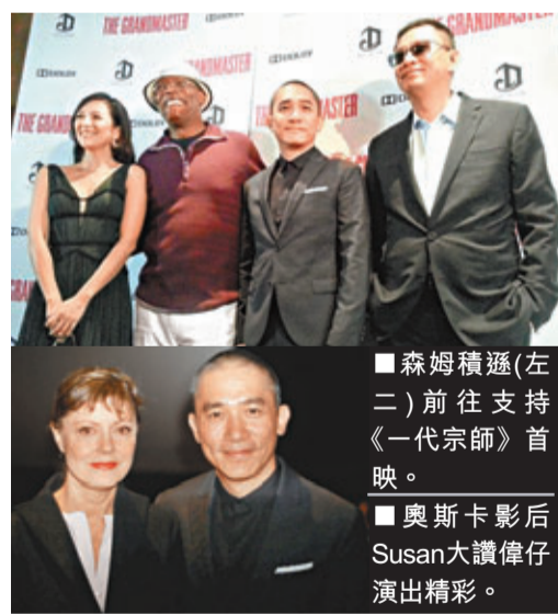
森姆積遜 (左二) 前往支持《一代宗師》首映。奧斯卡影后 Susan 大讚偉仔演出精彩。

聯絡。她大讚偉仔表現出色，尤其是看到偉仔為角色為影片付出了很大努力。首映禮上，偉仔接受外國媒體訪問，並吸引大批粉絲圍觀，難得見到偉仔，不少粉絲都想向偉仔獻花，可惜現場太多人，為免引起混亂，偉仔遺憾未能跟粉絲作近距離接觸。