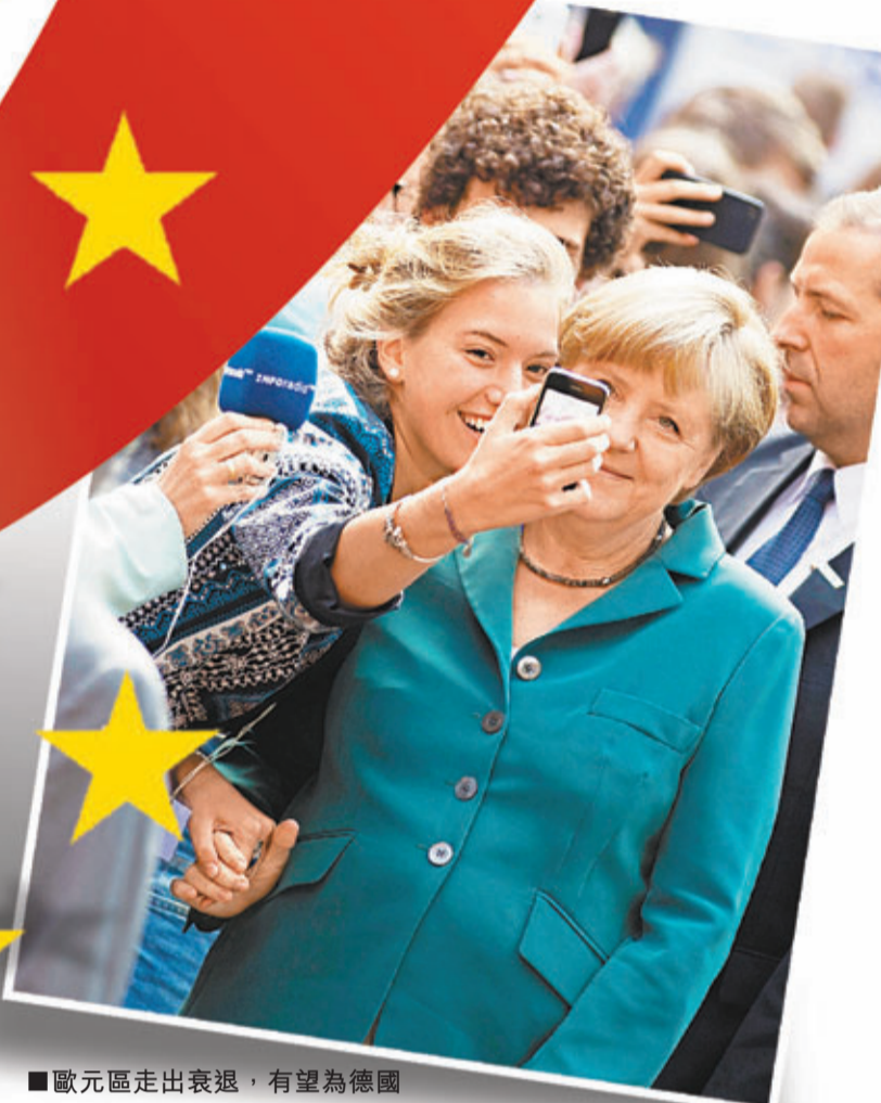
歐元區走出衰退，有望為德國總理默克爾在大選打下強心針。路透社