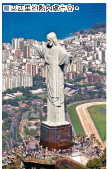
巴西里約熱內盧市容。