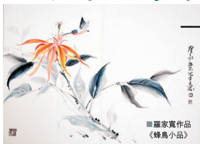
羅家寬作品《蜂鳥小品》