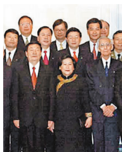
朱鎔基2002年11月19日會見香港特區政府主要官員時，梁振英（二排右二）也有出席。

該書並收錄了1988年與1990年，朱鎔基兩度會見當時還是香港特首梁振英的談話，內容皆圍繞上海發展中遇到的土地、住房等問題。他說，現在上海人民迫切要解決的一個問題，是住房問題，「上海人吃的方面還可以，就是住的太擠，一家人擠在一間小屋子裡。如果光靠國家投資造房，我看再過30到50年都解決不了上海的住房困難。」