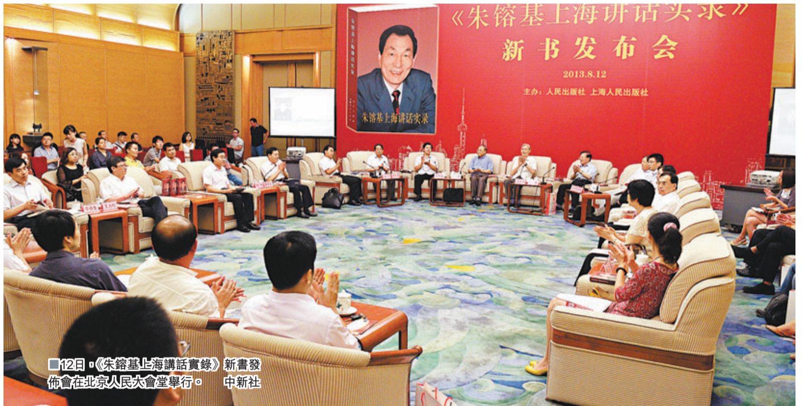
12日，《朱鎔基上海講話實錄》新書發佈會在北京人民大會堂舉行。

另據《南方周末》報導，1990年朱鎔基曾去香港、新加坡考察住房制度，回來後讓住房研究小組也前去取經。後研究小組在香港考察了10天，由現任香港特首梁振英陪同，之後又在新加坡一周考察了公積金制度。回國後，小組起草了《上海市住房制度改革實施方案》，獲國務院批准後於1991年5月1日開始實施，其內容概述為五句話，「推行公積金，提租發補貼，配房買債券，買房給優惠，建立房委會」。