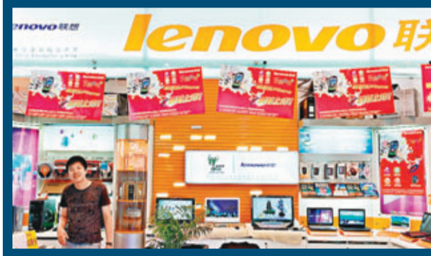
聯想歐洲業務佔總收益比重24%,股價近一個月累升一成。