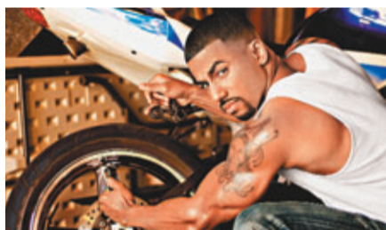
要包辦一切家居雜務兼換車胎的鐘點老公相信要有一定體能。