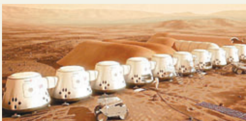
荷蘭「火星一號」移居火星計劃的構想圖。

荷蘭「火星一號」公司早前推出移民火星計劃，於2022年帶4人登陸火星，展開「一去不返」的新生活，一度被質疑是商業騙案。該公司宣布報名人數突破10萬大關，不少人更是《星球大戰》和《星空奇遇記》的影迷。不過參加者出發前需接受艱苦訓練，務求能在火星「自生自滅」。