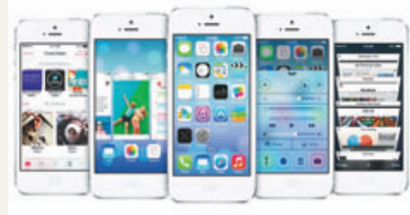
新機料與iPhone 5相似，或有指紋感應功能。

美國科技網站AllThingsD前日引述消息指，蘋果公司將於下月10日發布新一代iPhone。新機外觀設計料與iPhone 5分別不大，除鏡頭及處理器升級並搭載最新iOS 7作業系統外，亦可能增設指紋感應功能。根據慣例，蘋果發布新iPhone後，舊版將減價100至200美元(約776至1,551港元)，以針對中價市場。iPhone全球市佔率日漸萎縮，加上死敵三星窮追猛打，新機反應將影響蘋果前景。