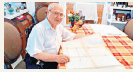
韋恩1976年以800美元出售蘋果股份，現升值至350億美元。網上圖片