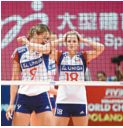
捷克兩連敗。

香港文匯報訊(記者 潘志南、郭正謙)中國女排昨日在世界女排大獎賽香港站賽事，以總局數3:0擊敗阿根廷，今日將與同告二連勝的土耳其爭奪冠軍。(無綫翡翠台今日1:15p.m.起直播)