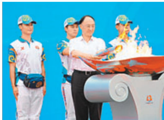
國家體育總局局長劉鵬(前)點燃火炬。

據稱，本着節儉辦全運的原則，十二運組委會一改往屆全運聖火在全國傳遞的傳統，1712名火炬手只在遼寧省內14個城市進行火炬傳遞。8月12日，火炬傳遞將抵達第二站大連。