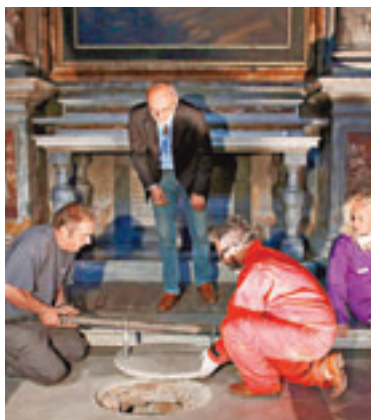
■考古人員解開古墓神秘面紗。