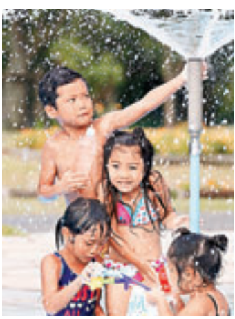
■熊谷市兒童玩水消暑。

另一方面，秋田縣前日受暴雨侵襲引發泥石流，搜救隊昨日挖出4具屍體，尚有1人失蹤。 ■中央社/共同社/日本《讀賣新聞》