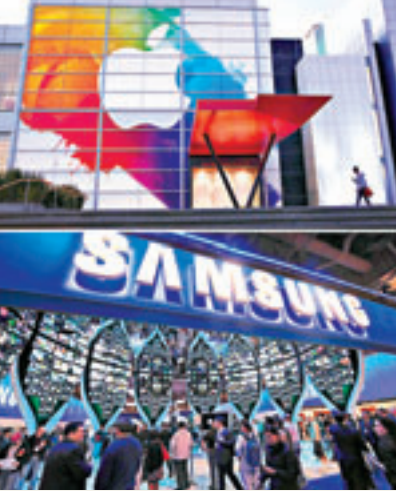
■蘋果(上)控訴三星侵權案勝訴。法新社

另外，美國反壟斷律師前日入稟紐約聯邦法院，指多家出版社聯手抬高電子書價格，要求當局勒令蘋果中止與這些書商的合約，未來兩年開放其他書商經銷蘋果iPad及iPhone的手機程式(app)出售電子書，令市場恢復公平競爭。 ■美聯社/法新社/《華爾街日報》