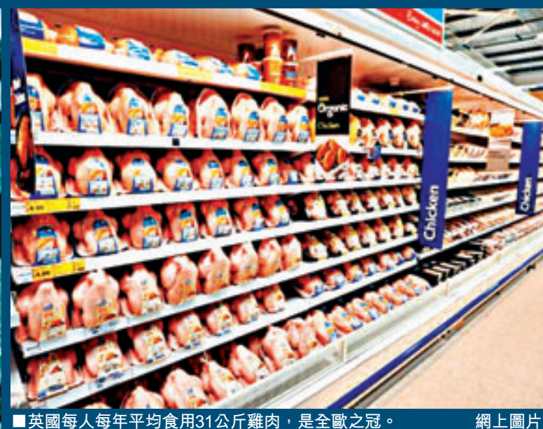
■英國每人每年平均食用31公斤雞肉，是全歐之冠。