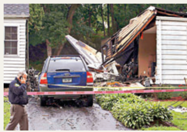
■警方調查私人飛機失事現場。