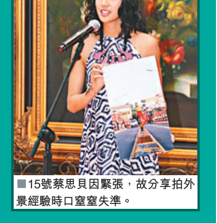
15號蔡思貝因緊張，故分享拍外景經驗時口空空失準。