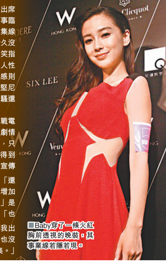
Baby穿了一條火紅胸前透視的晚裝，其事業線若隱若現。

香港文匯報訊(記者 李慶全) 楊穎(Angelababy)、陳柏宇及陳思健等獲邀出席酒店周年慶祝活動，不過最近跟古天樂傳緋聞的唐詩詠本在獲邀之列，但因事臨時缺席。Baby已近半年沒在港出席過活動，主要是專攻內地市場拍戲和朝劇集線發展，她坦言着實有點掛念香港，只可惜下半年仍要繼續在內地工作。Baby久沒在港亮相，昨晚即穿了一條火紅胸前透視的晚裝，其事業線若隱若現，她帶笑指也是出活動前於髮型屋試裝才看到設計，不過她亦不介意稍作性感，畢竟女人性感起來蠻美，但她當然不會暴露，偶爾性感是可以的。問到要是厚酬，會否接受行比堅尼泳衣騷？Baby笑說：「拍照可以考慮，行騷還是留給較高的模特兒。」