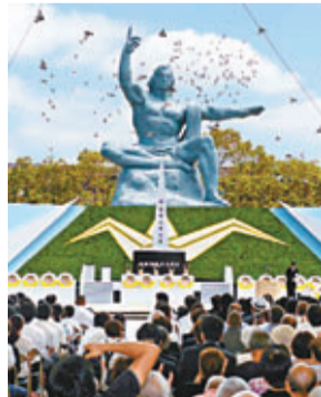
儀式上放白鴿寓意和平。

昨日為日本長崎市原子彈爆炸68周年，當地早上在和平公園舉行紀念儀式，日本首相安倍晉三、當年的生還者，以及家屬代表等5,600人出席。長崎市長田上富久在和平宣言中，狠批政府對銷毀核武器表態不積極，「辜負世界期待」，並「要求安倍政府重返作為核爆受害國的原點」。