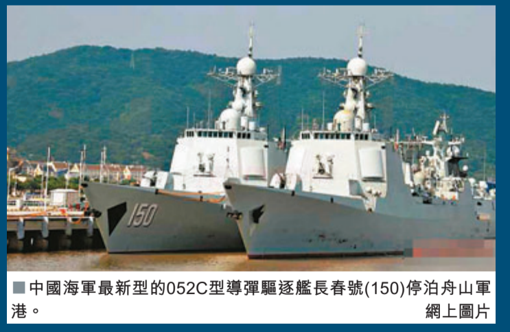
中國海軍最新型的052C型導彈驅逐艦長春號(150)停泊舟山軍港。

香港文匯報訊 東海艦隊的三大海軍基地（上海基地、舟山基地、福建基地）中浙江舟山定海軍港是東海艦隊的最主要的軍港。這個基地直對日本九州島和台灣島之間的第一島鏈斷鏈處，是中國海軍進入西太平洋最寬闊的公海水道。近日，有網友拍攝到了舟山軍港內的場景。可以看到軍港內停靠了大大小小十餘艘戰艦，有驅逐艦、護衛艦、補給艦等等，包括了中國海