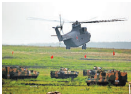
中方裝甲車等待俄方參演直升機補油。