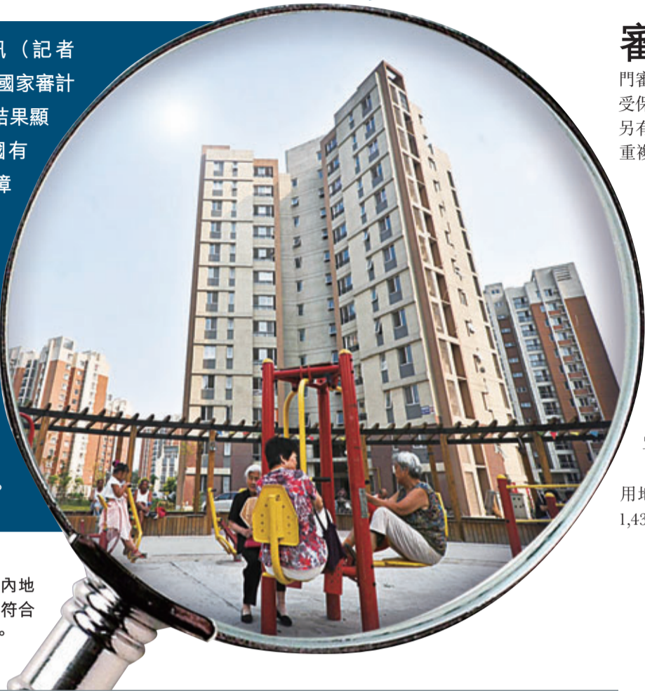
審計署指去年內地共有逾10萬戶不符合保障條件享補貼。

香港文匯報訊（記者 海巖 北京報道）國家審計署最新發布審計結果顯示，2012年全國有超過6.5萬套保障性住房被違規分配或租售，57.99億元保障性安居工程專項資金被挪用，超2000畝土地被違規使用，逾10萬保障房戶違規享補貼。