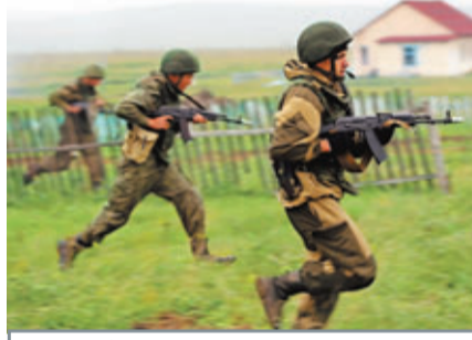
俄方參演官兵果敢衝入反恐陣地向前突擊。