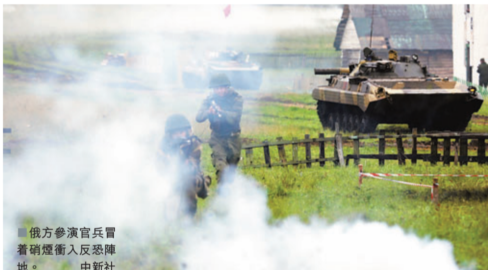
俄方參演官兵冒着硝煙衝入反恐陣地。