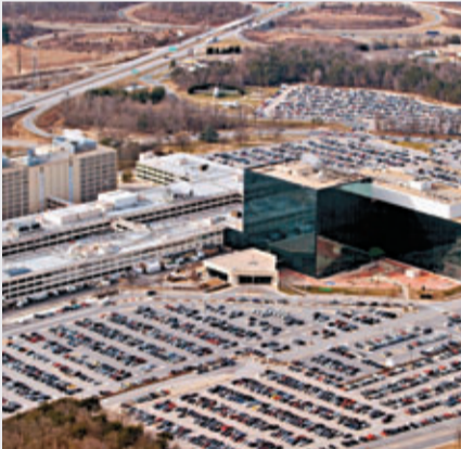
■國安局打算裁減大部分系統管理員。