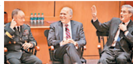
■(左起)NSA、CIA及FBI局長出席網絡保安峰會。