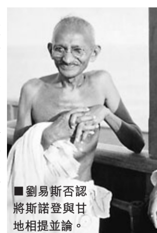
■劉易斯否認將斯諾登與甘地相提並論。

英國《衛報》報道，美國佐治亞州國會議員兼民權領袖劉易斯談論斯諾登時，將他與印度聖雄甘地相提並論，又指斯諾登訴諸於「更高層次的法律」。美國保護洩密者組織「政府問責計劃」(GAP)前日向斯諾登頒發「2013年告密者大獎」，表揚他揭發華府的大規模監控行動，並給予3,000歐元(約3.1萬港元)獎金。