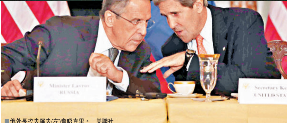
■俄外長拉夫羅夫(左)會晤克里。