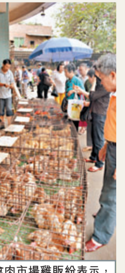
廣州禽肉市場雞販表示，將減少入貨量。

記者在廣州越秀區部分菜市場看到，得知惠州禽流感消息的市民，當即決定不再購買肉。而有雞販接受本報採訪時表示，9日開始，將減少入貨量。「發生禽流感，最受傷的就是我們這些雞販子，我認識的同行，都在討論這件事，大家都說會減少批發量。」廣州珠光肉菜市場一位雞檔老闆告訴記者。昨日仍有不少市民前來購買雞肉。雞檔老闆介紹，9日銷量並未有明顯變化，但相信次日開始，吃雞肉的市民會大量減少。