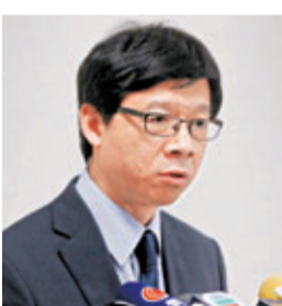
衛生署衛生防護中心總監梁挺雄。

香港文匯報訊（記者 聶曉輝）香港方面昨日已接獲廣東省衛生廳通報上述人類感染H7N9禽流感的懷疑個案，特區衛生署衛生防護中心總監梁挺雄昨日在記者會上表示，食物及衛生局局長高永文已即時召開跨部門會議，商討應對措施。他指出，內地至今已累積133宗H7N9禽流感病例，死亡率高達30%，且已在廣東省出現，故香港不能掉以輕心，將繼續病毒監察，做好口岸防控工作。