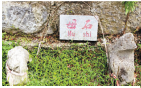
■白褲瑤村寨隨處可見的母石。

從拉片村支書謝永光口中得知，為了報答祖先對白褲瑤人的生育之恩，各家各戶的白褲瑤人都很重視兩塊石頭的香火延續，逢年