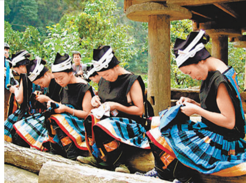
■正在刺繡的白褲瑤婦女。

在黔桂交界的貴州省荔波縣瑤山鄉拉片村，群居着瑤族一個自稱「布諾」的支系——白褲瑤，當地婦女至今仍保留着原始狂野的遠古遺風：上身着兩片黑色衣服，不穿內衣。隨着兩隻手臂抬起和擺動間，高聳的乳房便全部露出來，但她們並未為此感到羞怯。因令人稱奇的服飾文化及保留完整的婚嫁嫁娶等習俗，白褲瑤被聯合國科教文組織認定為民族文化保留最完整的一個民族，被稱為「人類文明的活化石」。特別是其服飾所蘊含的母系氏族遺風，對於沒有文字的白褲瑤來說，已成為其傳承民族歷史文化的「無字史書」。