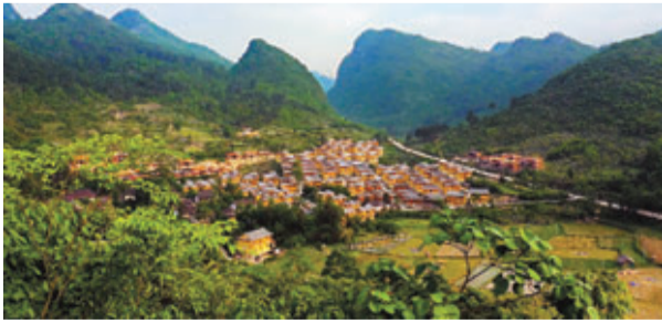
■越來越多的白褲瑤被安置到山下。

二十多年前，拉片村白褲瑤人大多居住在水、電、路「三不通」的深山密林中。謝永光還記得自己的父輩們過的都是半狩獵半農耕的生活。「放一