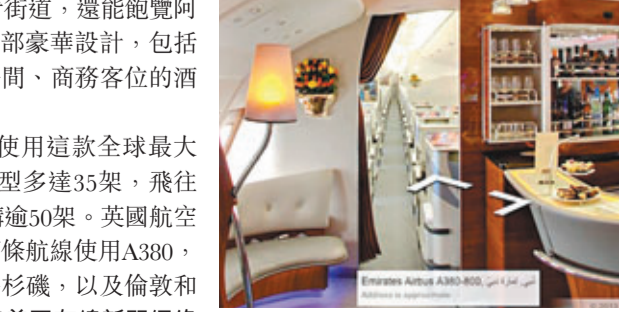
Google街景可飽覽A380內部設計。

Google街景地圖不但可查看街道，還能飽覽阿聯酋航空A380空中巴士的內部豪華設計，包括駕駛艙、上層頭等艙的淋浴間、商務客位的酒吧，以及下層經濟客位。阿聯酋航空5年前開始使用這款全球最大客機A380，現時同種機型多達35架，飛往21個地點，並已再訂購50架。英國航空亦將於10月開始在兩條航線使用A380，分別來回倫敦和洛杉磯，以及倫敦和香港。 ■美國有線新聞網