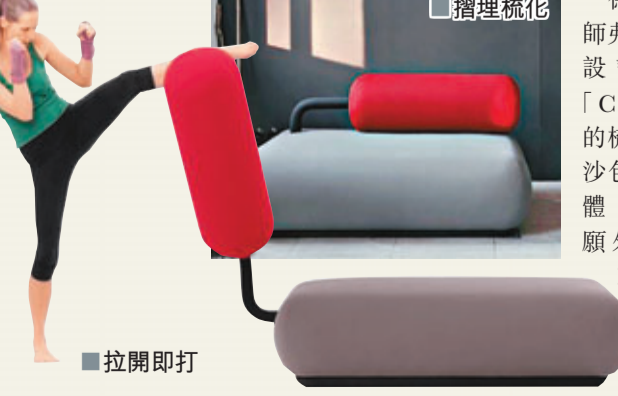
捲埋梳化 拉開即打

德國設計師弗蘭策爾設計名為「Champ」的梳化，與沙包融為一體，造福不願外出做運動的懶人。沙包平時可躺下作為梳化靠背，當用家想做運動或發洩時，只需數秒便可拉起沙包。梳化以人手製造，售3,000英鎊(約3.6萬港元)。