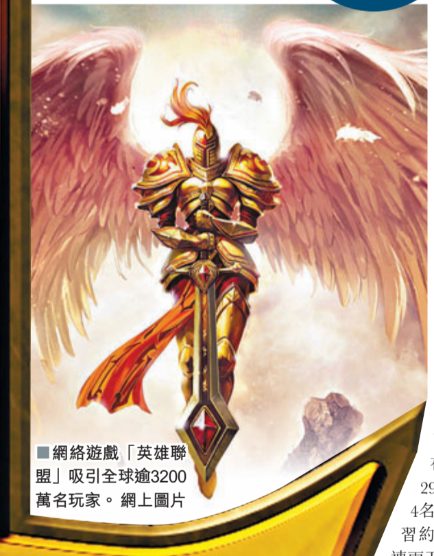
網絡遊戲「英雄聯盟」吸引全球逾3200萬名玩家。

網絡遊戲「英雄聯盟」其中一名全球最頂尖打機高手，5月底獲美國政府批出傑出運動員簽證，在當地居住並跟隊員練習準備比賽。這類簽證原本只發給傳統運動員，今次決定反映當局承認「英雄聯盟」是專業運動。