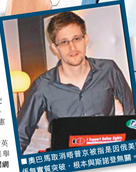
奧巴馬取消會晤普京被指是因俄美關係無實質突破，根本與斯諾登無關。