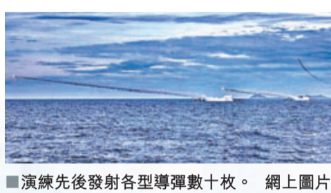
演練後發射各型導彈數十枚。

海軍軍訓部門負責人介紹,此次演練是海軍年度例行軍事訓練,演練全程在複雜電磁環境下進行,全程依托基於信息系統一體化指揮平台,全程體現真打實備的訓練作風和訓練導向,全面鍛煉和提高