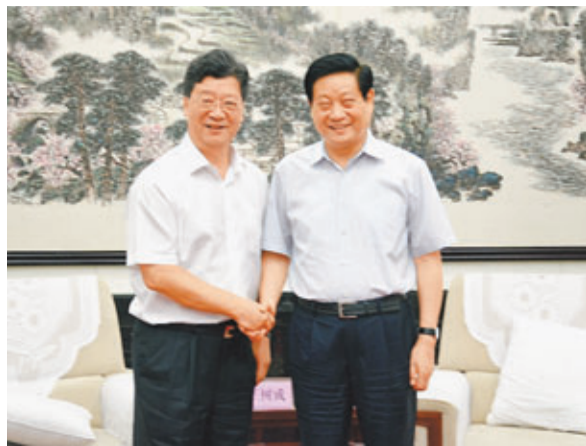
陝西省委書記趙正永(右)會見本報社長王樹成。

香港文匯報訊(記者 李陽波、張仕珍 西安報導)陝西省委書記趙正永8日下午在西安會見香港文匯報董事長、社長王樹成一行。趙正永表示,「十一」期間,陝西實現超超戰略,拐彎超車,特別是今年上半年,陝西經濟保持11%的穩步增速。在經濟高速發展的同時,陝西還強力推進民生領域改革,讓老百姓享受到真正的實惠。未來陝西將繼續加強與香港之間的經貿、文化等領域的交流與合作,促進陝西赴港招商常態化。