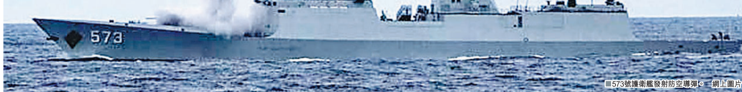
573號護衛艦發射防空導彈。網上圖片

隨著信息化條件下訓練的深入,該支隊官兵逐步養成搜集作戰訓練數據的意識。每次出海訓練,官兵都會記錄潛艇運行參數、戰場消耗等信息數據,並逐漸形成「數據庫」。經過對數據的系統分析,深入研究,他們對魚雷發射全過程的13類數據按作戰需求進行整合,對影響發射速度的操作、口令進行修改,使攻擊反應速度提高了10餘秒,增強了潛艇整體攻防能力。