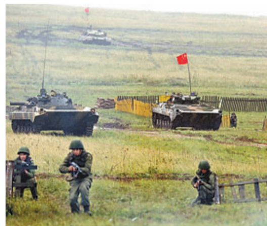
中俄首次合練,兩軍官兵協同作戰。

香港文匯報訊 據新華網報道,「和平使命—2013」中俄聯合反恐軍事演習8日在俄羅斯切巴爾庫爾合同訓練場舉行第一次實兵合練。