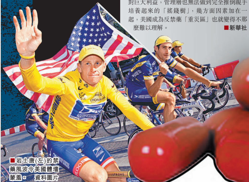
岩士唐(左)的禁藥風波令美國體壇蒙羞。