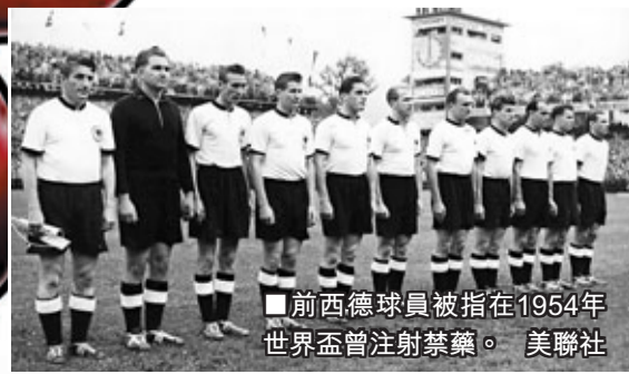
前西德球員被指在1954年世界盃曾注射禁藥。

德國社民黨及自民黨聯邦議員已要求聯邦議院體育運動委員會召開會議，對這事件展開特別辯論和調查，以向公眾進一步澄清真相；而即將參加國際奧委會主席競選的德國奧委會主席巴赫則表示，這份報告的正式公布將有助於德國體育正視過去，德國奧委會歡迎對此事進行全面公開的調查。