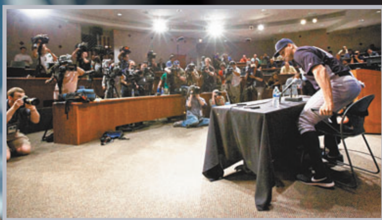
羅德里格斯(右)決定就停賽判罰提出上訴。

美國職業棒球聯盟(MLB)爆出大規模禁藥醜聞，包括3名全明星球員在內的13名球員，因大量擁有和使用禁藥並試圖誤導監督機構的調查，周一各被判罰停賽，當中效力紐約洋基的38歲球星羅德里格斯的停賽場數多達211場。再度爆出的禁藥醜聞，不但讓美國體育界蒙羞，也讓世界體壇為之震動。