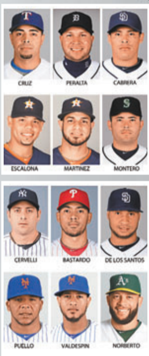
12名MLB禁藥球員全被判罰停賽50場。

禁藥問題又出現在美國，美職棒周一開出的巨大罰單，彰顯禁藥問題的嚴重程度，13名球員被判罰停賽的史無前例處罰，讓美國體育再度蒙羞。從單車名將岩士唐到職業棒球，禁藥成為籠罩在美國體育界上空揮之不去的陰影。作為奧運會金牌的第一大國，世界體育的超級巨擘，美國體育為何總與禁藥扯上千絲萬縷的聯繫？