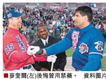
麥奎爾(左)後悔曾用禁藥。資料圖片

有禁藥，隨後他承認自己使用了類固醇類禁藥。在該個賽季，麥奎爾打出70記本壘打，創造MLB歷史新紀錄。退役後，麥奎爾成為教練，曾經在聖路易紅雀和洛杉磯道奇執教，他透露自己在執教期間，反覆向球員強調禁藥的危害，他說：「使用禁藥真的很不值。」在16年的MLB職業生涯中，麥奎爾打出583個本壘打，是聯盟史上最出色的球星之一，但因為禁藥事件，他幾乎鐵