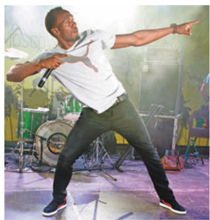
保特已身在莫斯科。

世界田徑錦標賽本周末在莫斯科揭幕，國際田聯周一表示今屆賽事將會進行30年來最全面的反禁藥計劃，包括賽前的大規模血液測試，早前連串爆出禁藥醜聞的牙買加，全隊已在周一接受藥檢；而土耳其田徑協會亦在世錦賽開賽