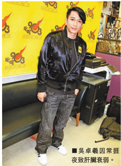
吳卓羲因常捱夜致肝臟衰弱。