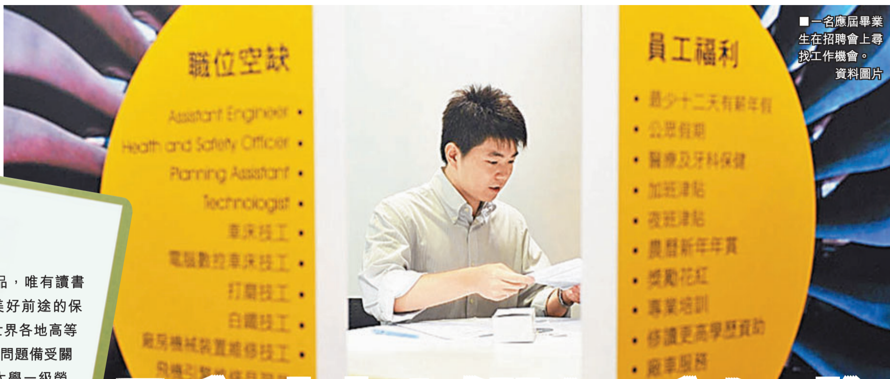
一名應屆畢業生在招聘會上尋找工作機會。資料圖片