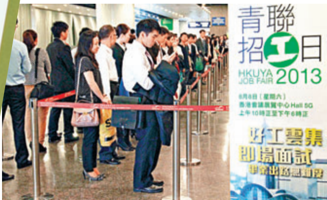
香港青年聯會舉行第五屆招聘日，求職者在排隊入內。資料圖片

政府去年發表的《二零一八年人力資源推算報告》，總結及展望2018年本地人力資源供求情況。香港《文匯報》記者深入分析當中數據，發現高學歷人士未來可能面對嚴峻的就業情況。因應近年大學研究院，特別是自資碩士課程越開越多，造成高學歷人才供求失衡的趨勢，報告按教育程度劃分的人力供應推算，指於2010年至2018年間，香港擁研究院學歷並會投身人力市場者平均增長率達7.1%，以人口計累積會由約15.5萬大增至約26.8萬，增幅高達73%。