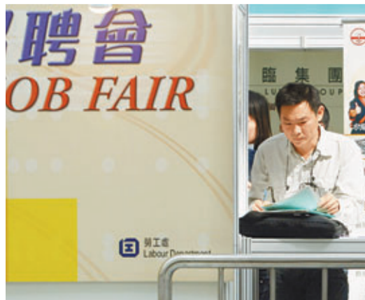
求職者在招聘會上準備求職資料。資料圖片