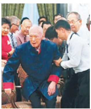
■李光耀出席新書發布會。