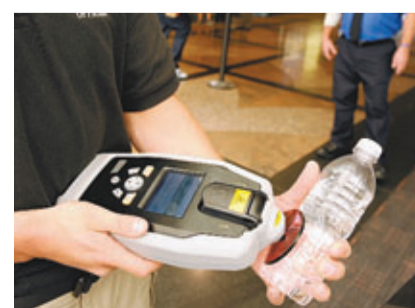
■「炸彈液」變乾後連安檢也無法偵測。

美國廣播公司(ABC)前日引述消息稱,恐怖組織「基地」懷疑研製新型液態炸彈,普通衣物只要浸泡「炸彈液」,變乾後成為安檢無法偵測的炸彈,對西方國家構成威脅。