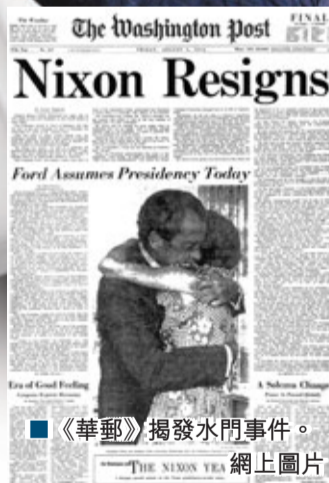
■《華郵》揭發水門事件。網上圖片

揭水門案揚威 尼克松黯然下台 《華盛頓郵報》是美國著名報章,號稱政界精英家中必備讀物,20世紀多宗大新聞均是《華郵》記者的傑作,包括披露華府越戰機密的「五角大樓文件」及促使前總統尼克松下台的水門事件,連最近的華府監控風波,《華郵》是美國中情局(CIA)前僱員斯諾登最早接觸的兩家報章之一。