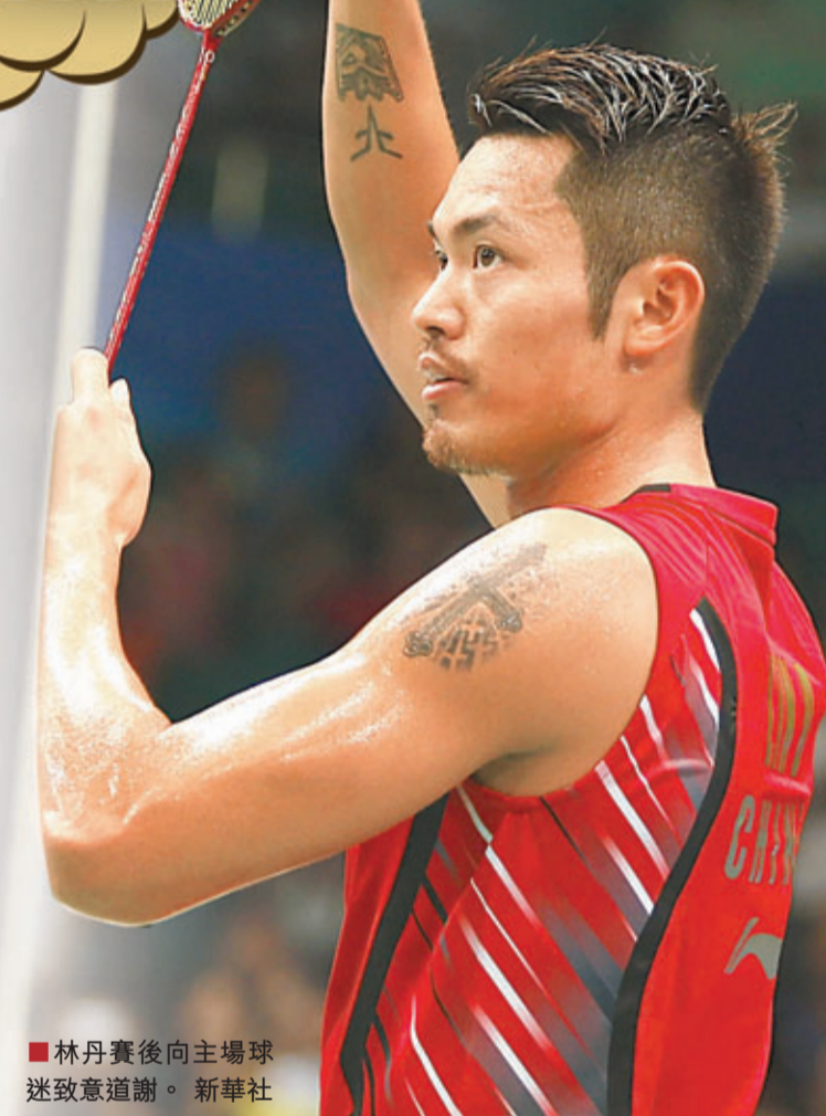
林丹賽後向主場球迷致意道謝。

首天的比賽，李宗偉早於林丹結束，以總局數2:0輕鬆戰勝對手埃文斯。他是人氣僅次於林丹的選手，賽後也受到大量媒體的追問。對於自己的表現，李宗偉表示，適應場地的時間很有限，比賽中出現了一些失誤，本場比賽可以給自己打70分。