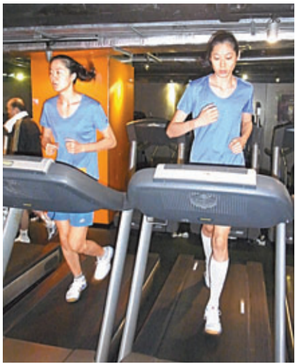
朱婷(右)和隊友劉聰聰跑步健身。

香港文匯報訊(記者 潘志南)中國女排昨日贏得世界女排大獎賽澳門站冠軍後，大軍昨日轉來香港，而另一批在北京基地的主力昨日亦已抵步會合。郎平重執國家隊教鞭後所徵召的20名球員，全數雲集香港，準備出戰本週五起在香港體育館舉行的香港站賽事。