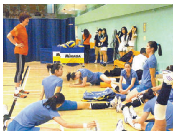
郎平率領由京來港的隊員到土瓜灣體育館訓練。

國家隊昨日兵分兩路訓練，在澳門比賽完的馬蘊雯、張磊、王一梅、朱婷和沈靜思等，在領隊胡進率領下，拉隊到紅磡健身中心跑步和用單車機輕鬆鍛煉體能；而從北京南下的一批隊員則往土瓜灣體育館訓練2小時。郎平在訓練時，只鍛煉一下隊員的球感和手感，而「郎導」自己亦有參與，她坦言：「我少運動，腿都沒有肌肉，運動就是要長肉，現在不是『鐵榔頭』，而是『紙榔頭』。」