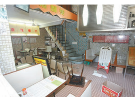
美都餐室地下遭搗亂後枱檯東西西倒。

警方跟進調查後，得悉歹徒得手後上了一輛私家車離開，至昨晚7時，探員發現涉案私家車停在永星里與鴉打街交界，稍後當姓周涉案男子露面取車時被探