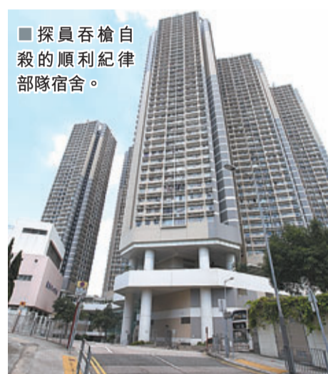
探員吞槍自殺的順利紀律部隊宿舍。