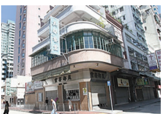
遭刑毀的美都餐室位於油麻地廟街與眾坊街交界。

理，但二樓雅座繼續營業。餐室老闆娘表示今次是開業60多年來首次被搗亂，損失暫未能計算。當記者追問事件是否涉及有人「收陀地」時，老闆娘表示無被勒索。