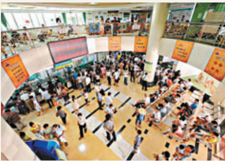
■天氣炎熱，福州醫院患者激增。

香港文匯報訊 據《廣州日報》報道，日前，某官方認證的天氣預報微博發佈了今年以來大城市的高溫排行榜：截至4日，高溫天數排在前十名的分別是長沙、重慶、杭州、台北、上海、福州、南昌、南京、鄭州和武漢。其中，長沙超過35℃的高溫天數達44天，重慶和杭州的高溫天數分別達到了37天和33天。長沙也坐上了連續高溫天數最多的「寶座」，連續高溫多達35天，時間超過一個月。而杭州連續高溫天也有19天之多。