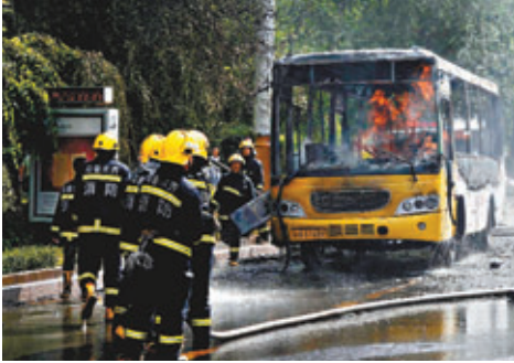
■烏魯木齊公交车起火，燒得只剩框架。