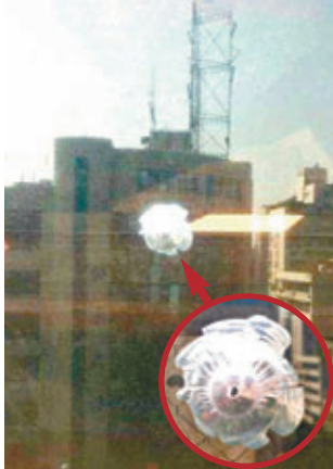
■宜賓日報社605辦公室窗戶玻璃出現彈孔。

香港文匯報訊 據《成都商報》報道，繼幾天前四川《宜賓晚報》總編輯、副總編輯辦公室先後發現彈孔後，昨日下午，宜賓日報社605辦公室再發現兩個新彈孔，臨街的窗戶玻璃被打出兩個圓洞。宜賓翠屏區警方刑偵人員已介入調查。目前尚未在辦公室內找到子彈頭，也沒有發現彈殼。