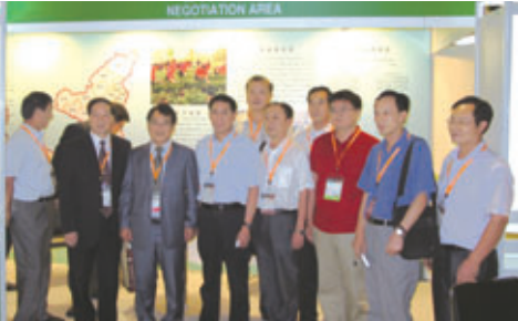
■去年陝西首次赴港參加國際茶展，取得良好成果。

據悉，為了充分利用香港國際茶展平台，讓參展企業取得良好經濟效益，今年，陝西省商務廳在加大對陝茶宣傳力度的同時，還積極與香港貿易發展局聯繫，為企業進行商務培訓，並提前預定最佳展位位置，協調出入境檢驗檢疫局、海關等部門，為企業茶品出境展銷排憂解難。