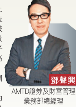
AMTD證券及財富管理 業務部總經理