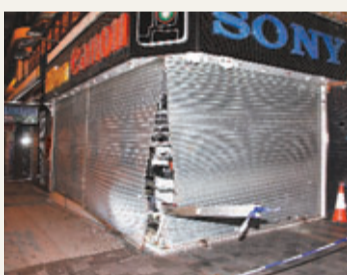
影音店舖鐵閘被撞毀。

香港文匯報訊(記者 杜法祖)尖沙咀彌敦道與金馬倫道交界一間影音店,昨清晨5時許被1輛私家車撞毀2扇大門鐵閘,疑車事後駛離。警員稍後在附近金馬倫里發現涉案私家車,惟已人去車空,警員隨後核實該車資料,證實並非失車,匙鑰亦沒有被撬痕跡,遂將其拖走調查,警方正聯絡車主協助調查內情。案件暫未有人被捕。