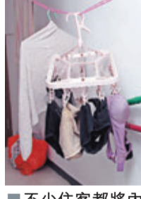
不少住客都將內衣褲晾在走廊。

香港文匯報訊(記者 杜法祖)葵涌和宜合道一幢大廈接二連三發生胸圍失竊事件,一名月前曾有曬胸圍不翼而飛的少婦,昨晨往梯間收回晾曬衣服時,又發現一個黑色胸圍失蹤,她擔心有變態狂徒在大廈出沒,對婦女構成威脅,決定報警求助。胸圍失竊現場為葵涌和宜合道122號新華銀行大廈,據悉,大廈不少居民習慣在雨天將曬晾衣服掛在走廊或梯間空位晾乾。昨晨7時許,一名女住客林太到