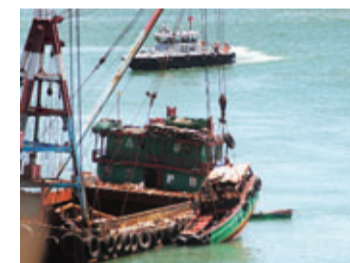
大型躉船將肇事沉沒的機動木船吊起。

當肇事船隻被吊起期間,遇難的3名死者其10多名家屬及親友,帶備香燭、冥鏹等祭品在船塢上進行海祭,各人神情哀傷,有家屬向海面撒冥錢,部分親友更按捺不住哀傷,失聲痛哭,一片愁雲慘霧。事發前日下午2時15分,1個經營廢鐵回收的祖孫3代5口家庭(16歲至73歲),租用1艘8米長,俗稱「大頭艇」的機動木船往青衣西草灣聯合船塢對開一個浮動碼頭