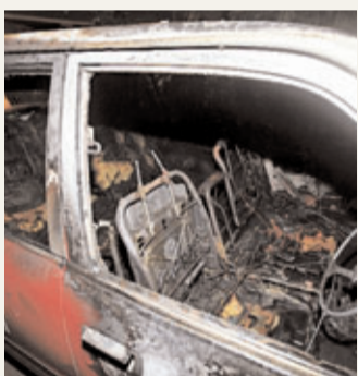
遭縱火的士嚴重焚毀。

香港文匯報訊(記者 杜法祖)長沙灣興華街西與連翔道交界一高鐵路盤對開,前晚11時許發生的士着火事件,一輛市區的士離奇着火焚燒,火勢猛烈,一名姓周(27歲)男子駕車經過馬上報警,消防員到場開喉將火撲熄,惟的士已嚴重焚毀,消防發覺的士頭尾車牌被拆去,認為起火原因有可疑,警方翻查資料,證實的士於7月30日已在荃灣區報失,案件交深水埗警區刑事調查隊跟進,追查的士是否牽涉其他罪案及被人放火焚毀的原因。