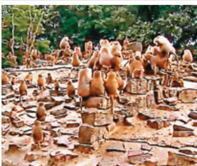
■多隻狒狒背向遊客靜坐，情形甚為罕見。

狒狒向來活潑好動，但荷蘭一個動物園的112隻狒狒上周突然異常，集體背向遊客靜坐，更絕食兩天。據稱今次已是牠們20年來第4次出現這種情況，連專家都無法解釋，有人認為狒狒可能感受到地震，甚至有人認為牠們可能受不明飛行物體(UFO)影響。