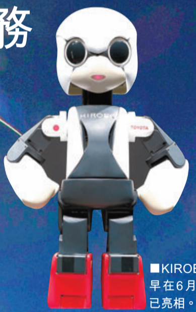
■KIROBO早在6月底已亮相。