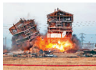
■消防局指傷者擅自越線。

美國加州中央谷一間廢棄蒸汽發電廠前日清晨以爆破方式拆除，吸引逾1,000名居民圍觀，其間有金屬碎片割傷5名民眾，一名44歲男子當場炸斷一隻腳，另一隻腳也可能要截肢。爆破公司發聲明慰問傷者，稱會全面調查事故。然而消防局指，所有傷者均擅自超越安全線，釀成慘劇。