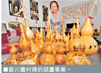
銀川農村婦的胡蘆事業。

的，方額、蓋石、頂上等均做了非常藝術化的處理，碑下有二層石台階，故稱《石台孝經》。 ■中國之聲