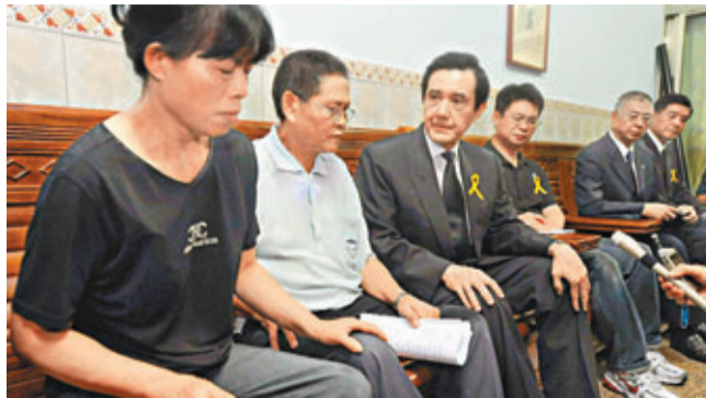
馬英九向洪仲丘父(左2)及母(左1)致意。

行政機構法政司政務總長羅雲雪表示，該委員會直接對行政機構首長江宜樺負責，成員將廣納民間聲音，包括律師公會代表、公民團體代表等；行政部門方面，除法務、防務外，將視必要如驗傷報告再復查等，不排除納入衛福部、警政署等相關部會，擴大組成單位。