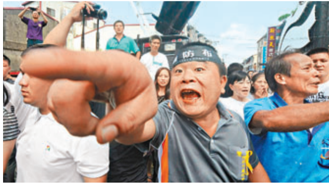
情緒激動的民眾高呼：「要真相！」