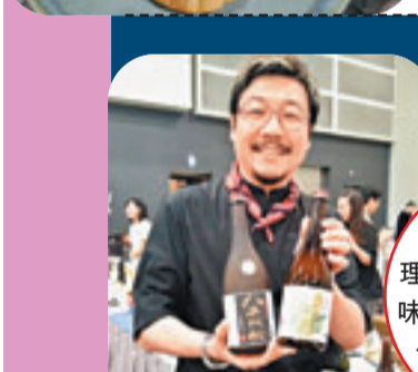
Ken San料理，以日本健康調味料「鹽麴」來製作美食。