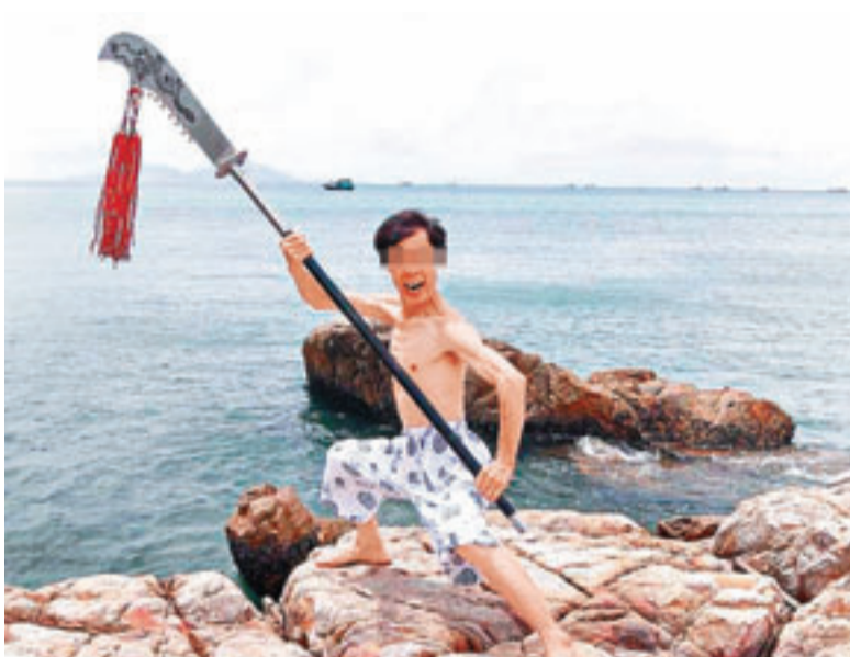
關刀漢fb貼圖，揚言今日要「血洗」旺角撐林慧思。

香港文匯報訊(記者 文森)就反對派近日散播流言，聲稱解放軍駐港部隊將出動對付「和平佔中」。警務處行動處處長黃志雄昨日指出，執法部門正密切留意「佔中」事態發展，但警方與解放軍有明顯分工，「佔中行動」與尋求解放軍協助「扯不上關係」。 黃志雄昨日在接受電台節目訪問時指出，警方正密切留意「佔中」的事態發展，而被問及警方在處理「佔中」時，「發展至甚麼階段才會尋求解放軍協助」，他強調兩者「扯不上關係」。根據《基本法》規定，警方與解放軍有合作機制，當出現政府不能應付的災難或動亂時，可主動要求中央派出駐港部隊處理，而駐軍是保衛香港領土安全，警方則是負責區內秩序，兩者有清楚劃分的分工。