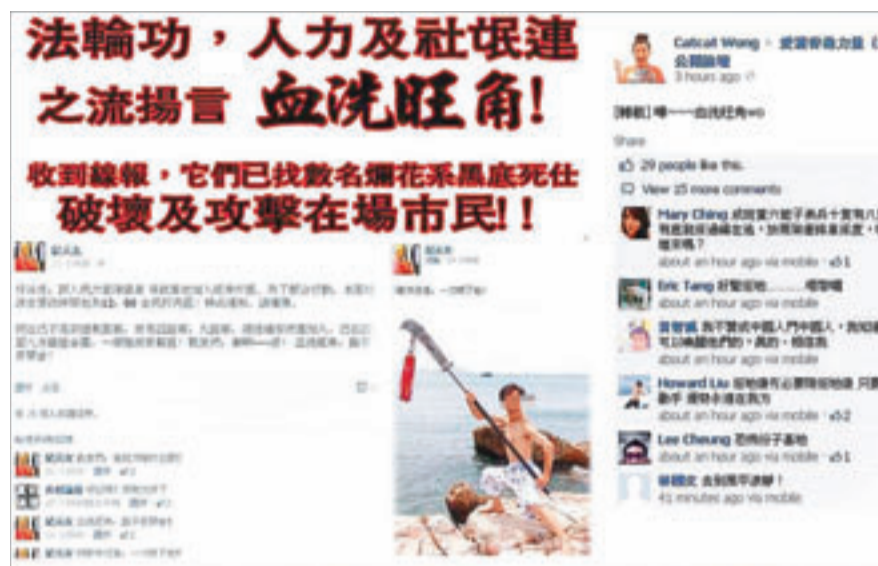
「愛港力」轉載關刀漢的恐嚇字句，提醒今日參與簽名會的市民小心。